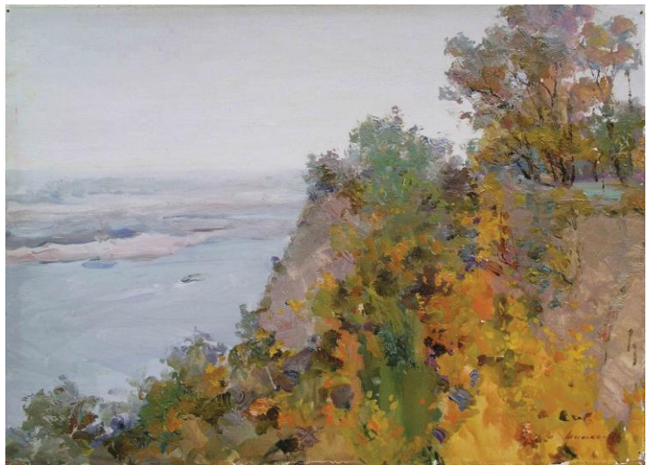
Сергій Шишко. Осінь. Берег Дніпра

Дніпро є основним джерелом водопостачання в Україні, також на ньому розташовані гідроелектростанції.