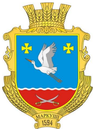
Герб села Маркуші (Бердичівський район Житомирської області)