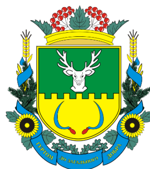
Герб Олександрівського району (Кіровоградська область)

Герб села Маркуші. Лелека — символ пильності, любові, вдячності, ніжності. Хрести — поміркованість, розум, справедливість, мужність. Саме такі хрести були основними символами українських козаків, що захищали мешканців Маркушів. Хвиляста лінія посеред герба символізує місцеву річку Глибока долина.