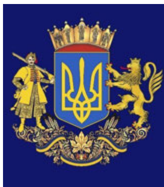
Джерело 2. Один із проєктів великого Державного Герба України