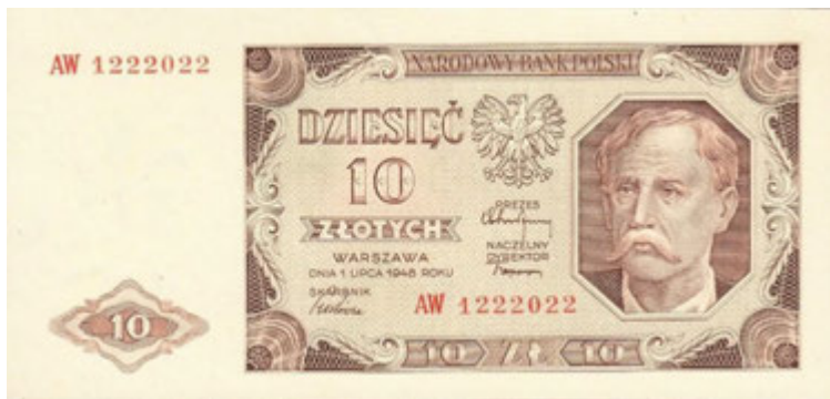
Джерело 7. Польська банкнота вартістю 10 злотих. Середина 20 ст.

Палеоботаніка (від грец. palaios — стародавній і botanē — рослина) вивчає викопні рослини, допомагає визначити, що росло на певній території в давнину. Геродот писав, що скіфи вирощували просо. Палеоботаніки уточнюють: не лише просо, а і ячмінь та жито, адже їхні сліди знайшли біля поселень. Оскільки жито вирощувати важче, ніж просо, то вчені вважають, що його залишки біля людських поселень свідчать про розвинене сільське господарство.