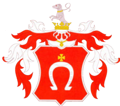
Джерело 1. Родинний герб козацького гетьмана Петра Конашевича-Сагайдачного. Кінець 16 — початок 17 ст.