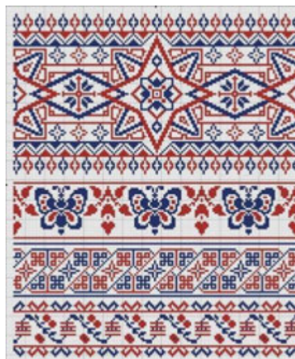
Схеми вишивок з брошур Брокара