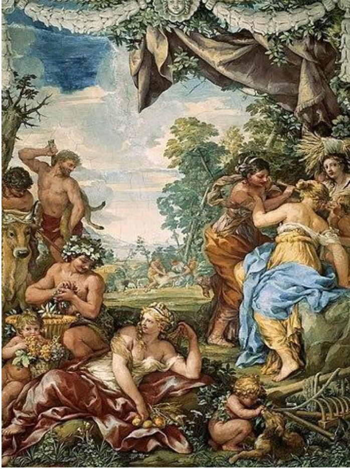
Джерело 1. П'єтро да Кортоні. “Золотий вік”. 1641–1646 рр.