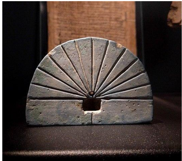
Джерело 4. Давньоєгипетський сонячний годинник. Державний музей, Нідерланди

З точністю до хвилини, як ми звикли, час вимірюють лише півтора століття, хоча перші годинники з'явилися ще в стародавньому Єгипті. Раніше люди прокидалися на світанку, обідали опівдні, коли сонце стояло угорі посеред неба, спати лягали, коли темніло. Усе змінила промислова революція. У містах з'явилися фабрики й заводи. Їхні працівники мусили приходити на роботу в чітко визначений час і не могли піти додому просто тому, що надворі вже темно.