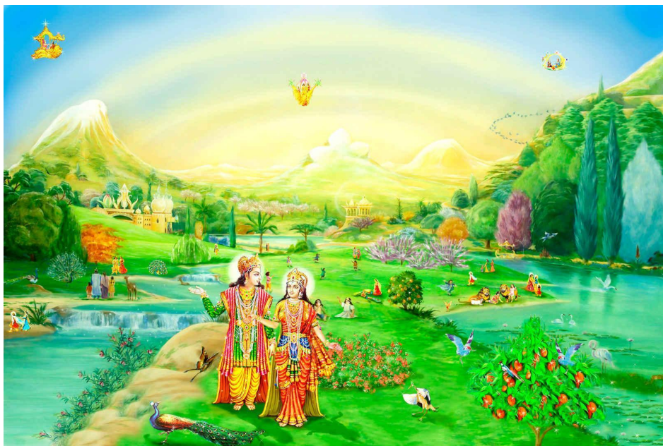
Джерело 2. Автор невідомий. Так в Індії уявляли “Золотий вік” (Сатья юга)