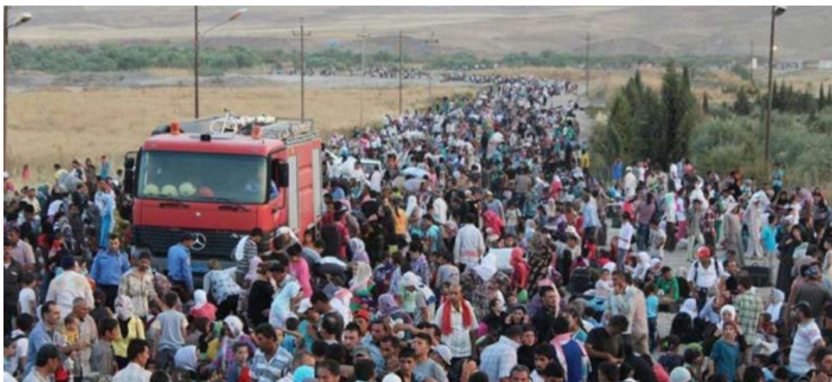
Джерело 4. 2013 рік. Кордон Сирії з Іраком. Сирійці намагаються врятуватися від громадянської війни