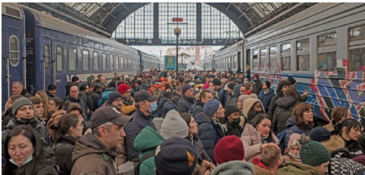
Джерело 3. Лютий 2022 року. Вокзал у Львові. Українці намагаються виїхати до Польщі у зв'язку з повномасштабним вторгненням Росії