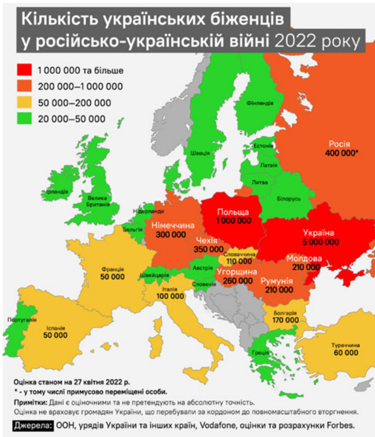
Карта 1. Кількість українських біженців у російсько-українській війні станом на 27 квітня 2022 року

Людам, які вирішили залишити домівку через тиск обставин, часто буває важко звикнути до нового місця. Вони сумують за батьківщиною, родиною, друзями, звичною їжею, власним ліжком. Подальша доля вимушених мігрантів складається по-різному. Хтось залишається на новому