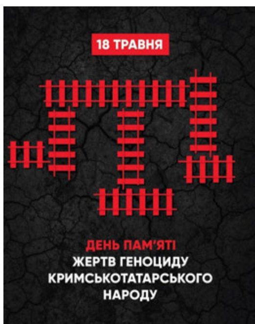
Джерело 2. Плакат до Дня пам'яті жертв примусового переселення кримськотатарського народу