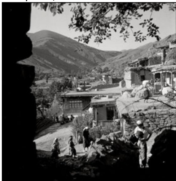
Джерело 3. М. Бахчисарай перед депортацією