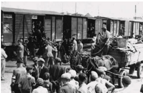
Джерело 12. Примусове завантаження українців у товарні вагони для депортації у віддалені регіони