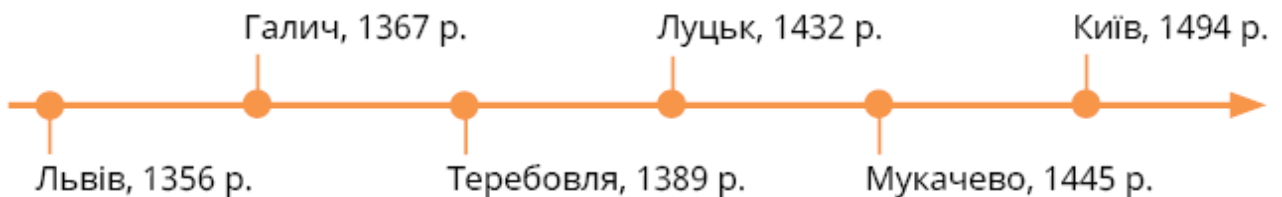
Схема 2. Надання магдебурзького права містам України