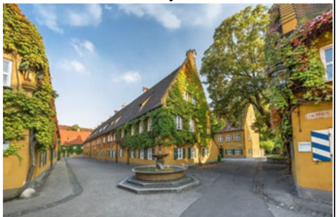
Вулички Фуггераю та будинки для неплатоспроможних мешканців