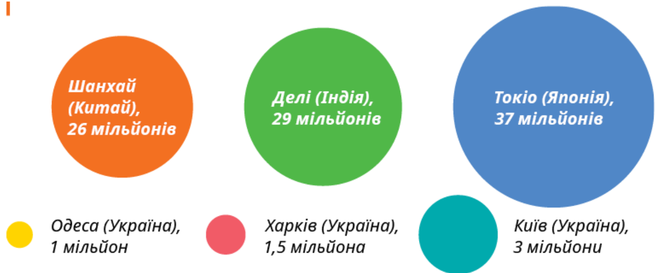
Схема 1. Населення міст-мільйонників

У середньому в столицях світу мешкає від 1 до 5 мільйонів людей. Але деякі міста — значно більші.