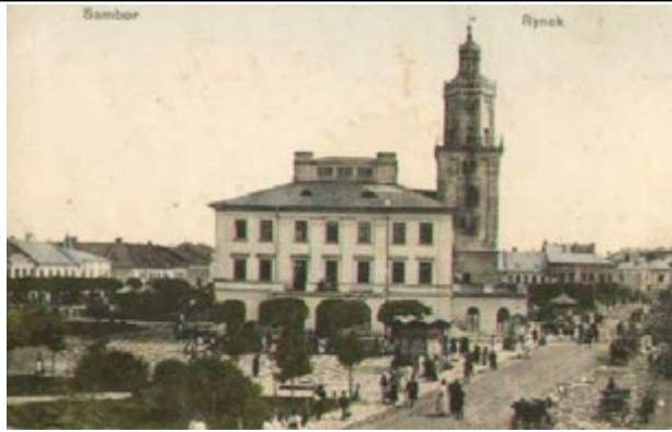
А. Ратуша у м. Самборі (Львівська область)