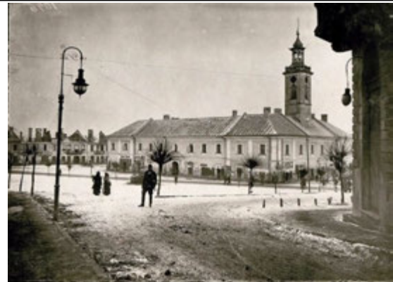
Б. Ратуша у м. Бережанах (Тернопільська область)