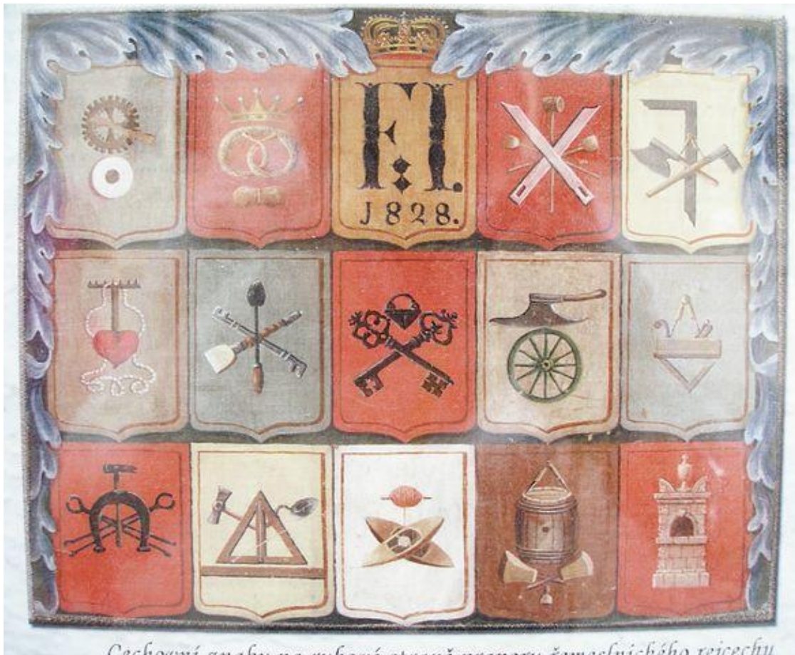
Джерело 3. Герби чеських ремісничих об'єднань