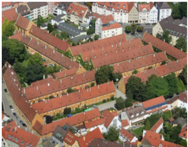
Квартал Фуггерай з висоти пташиного польоту

Тут мешкав у старості прадід композитора Вольфганга Моцарта.