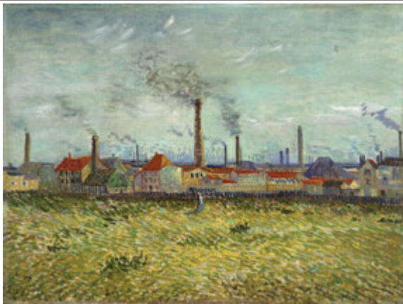
Джерело 8. Фабрики в Кліші. Вінсент Ван Гог, 1887 рік

8. Як змінився звичний вигляд місцевості з появою фабрик і заводів (джерела 7, 8, 9)?