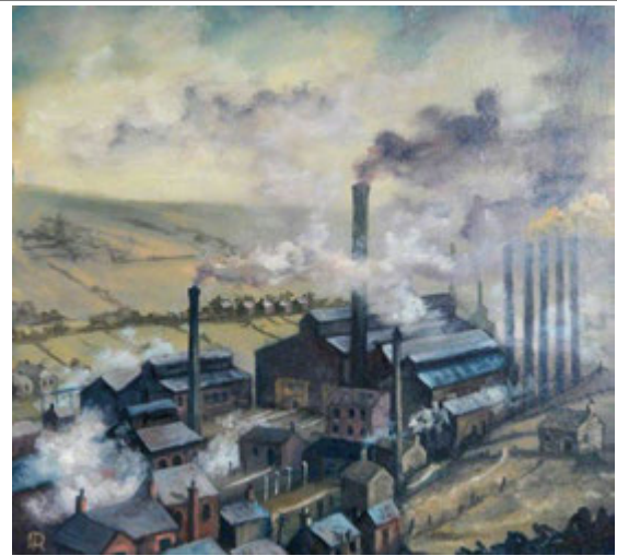
Джерело 9. Промислові будівлі з димоходами та димом, оточені будинками та полями. Роберт Пеністон, 1990 рік

9. Прочитай джерело 10 . Як впливав новий спосіб роботи на фабриках і заводах на самопочуття працівників? Що вони могли відчувати?