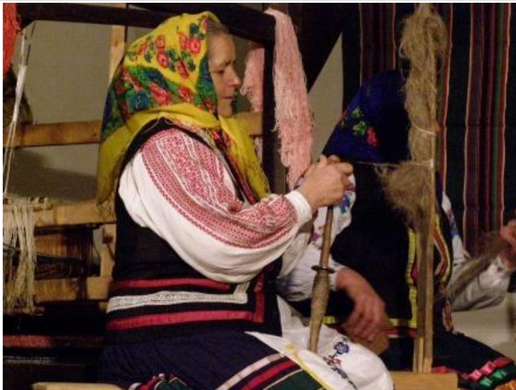
Джерело 3. Прядіння вовни