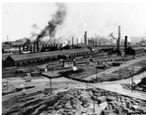
Джерело 7. Металургійний завод Джона Юза (тепер — Донецький металургійний завод). Кінець ХІХ ст.