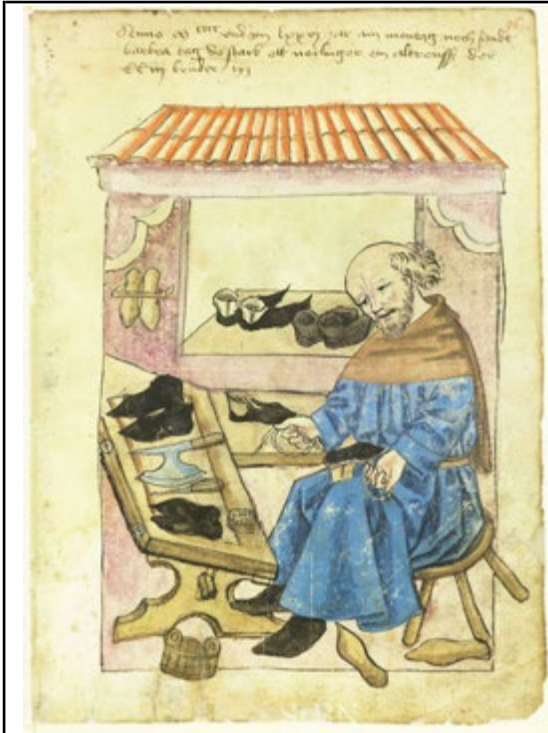
Джерело 1. Виготовлення взуття. Ілюстрація з "Домашньої книги" Фонду Дванадцяти Братів, Нюрнберг, XV ст.