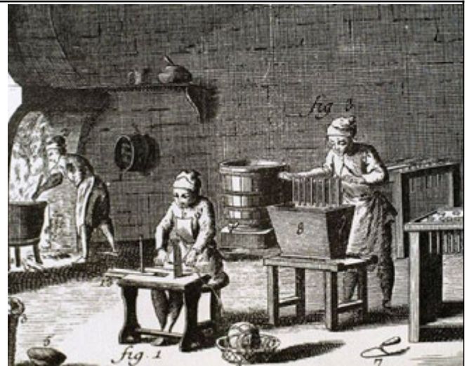
Джерело 2. Майстерня з виготовлення свічок, XVIII ст. Ілюстрація з Енциклопедії наук, мистецтв і ремесел

Домашні майстерні та мануфактури виготовляли дедалі більше товарів, вигадували нові знаряддя праці та техніки, але справжній переворот у виробництві стався в середині XVIII ст. Саме тоді ручну працю почала заступати машинна, а робоче місце перемістилося з майстерень до фабрик і заводів . Так стали називати великі підприємства з кількома сотнями чи навіть тисячами робітників і робітниць. Зміни були такими разючими, що їх назвали промисловою революцією .