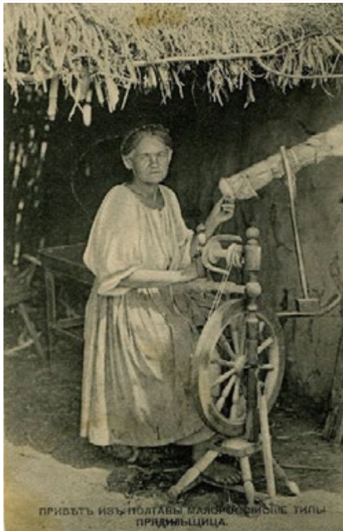
Джерело 4. Українська прядка. Поштова листівка з вітанням із Полтави

ПРИВІТЬ ІЗЪ ПОЛТАВИ МЛЯЧКОСИНОЕ ТИПЪ ПРЯДНИЦИЦА.