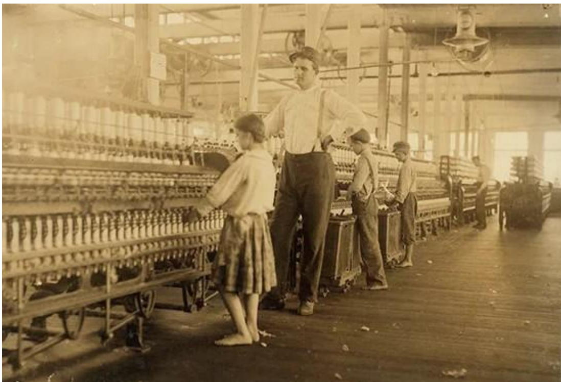
Діти працюють в цеху бавовняної фабрики. Льюїс Хайн, США, 1911 рік