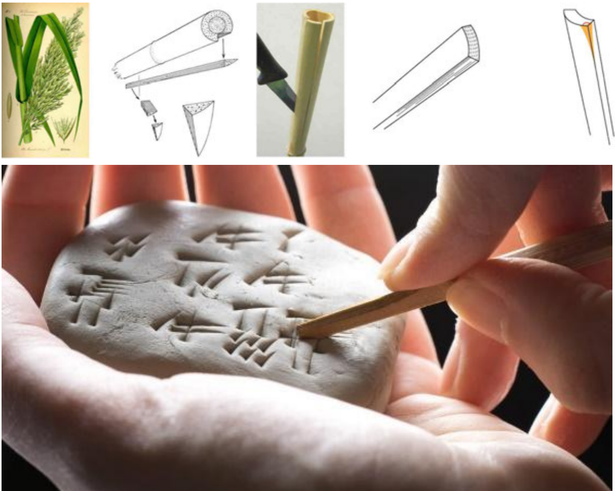
Джерело 2. Виготовлення стилуса для писання клинописом

Для писання шумери використовували палички – стилуси. Їх виготовляли зі стебел очерету, яким рясніли береги річок. Кінчик стилуса мав трикутну форму, його відтиск на глині нагадував клин. Тому писемність шумерів назвали клинописом .