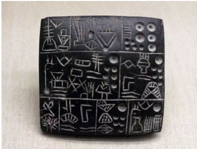
Джерело 1. Зразок піктографічного письма із шумерського міста Урук, 3200 р. до н.е.

3. Розглянь джерело 1 . Чи трапляються тобі подібні повідомлення в сучасному житті? Наведи кілька прикладів, як піктограми використовують у наш час.