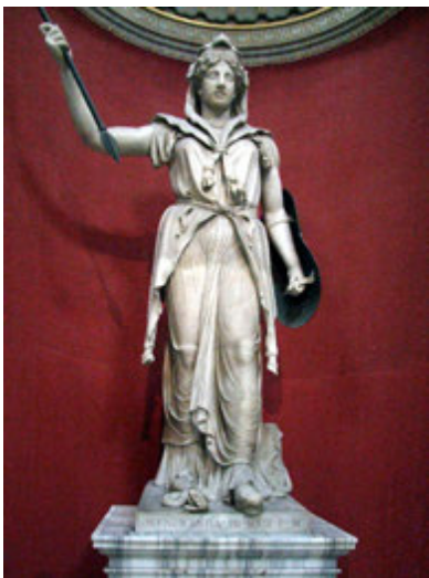
Джерело 1. Статуя давньоримської богині Юнони. II ст. н. е.

2. Спробуй пригадати пам'ятники у твоєму населеному пункті, схожі на ці ( джерела 1-3 ). Чи ти знаєш, кого вони вшановують?