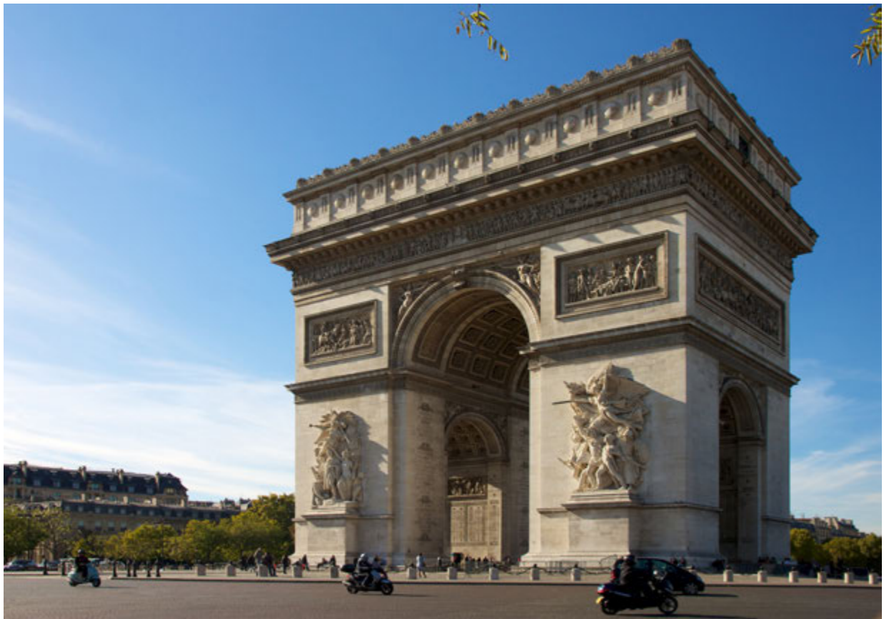
Джерело 4. Триумфальна арка, яку звів французький імператор Наполеон на честь своїх перемог. Париж, Франція