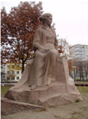
Пам'ятник рятувальникам, які гасили пожежу на Чорнобильській атомній електростанції у 1986 р. (м. Чорнобиль)