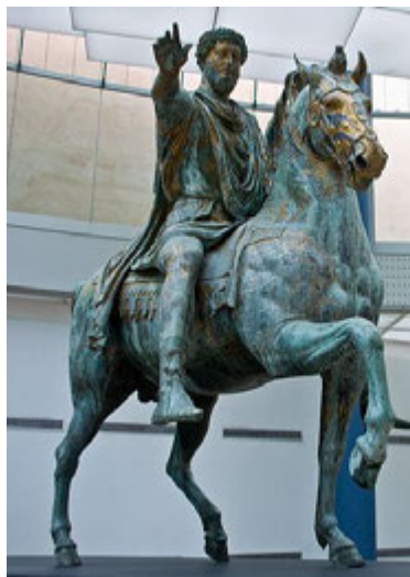
Джерело 2. Кінний монумент римському імператору Марку Аврелію. 175 р. н.е.