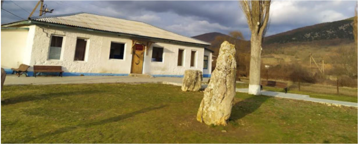
Скельський менгір, с. Родниківське, Крим. III—початок II тис. до н.е.

Такі звичні для нас форми увічнення поважних осіб, як кінна статуя, постать в повний зріст чи погруддя, прийшли до нас з античних часів. У Давньому Римі встановленням пам'ятників вшановували знать, богів та богинь і найважливіше — імператорів.