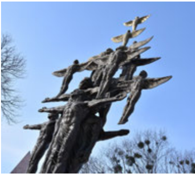
Пам'ятник Лесі Українці (Новоград-Волинський, Житомирська обл.)