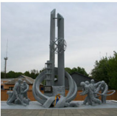
Пам'ятник героям Небесної Сотні (м. Суми)