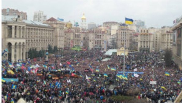
Фото 1. Масовий протест 1 грудня 2013 року в Києві. Пів мільйона людей вийшли на вулиці столиці, оскільки дізналися, що вночі "беркутівці" жорстоко побили студентів, які мирно протестували на майдані Незалежності. Масові акції непокори не припинялися 3 місяці й призвели до зміни влади в Україні. Пізніше їх назвали Революцією гідності.