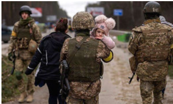
Фото 3. Українські військові захищають народ і незалежність України, 2022 р.