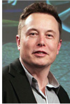
Фото 6. Ілон Маск. Найбагатша людина світу станом на 2022 рік. Засновник і співвласник компанії SpaceX, яка будує космічні кораблі й готує політ людини на Марс. Ілон Маск допомагає українській армії обладнанням для супутникового інтернету.