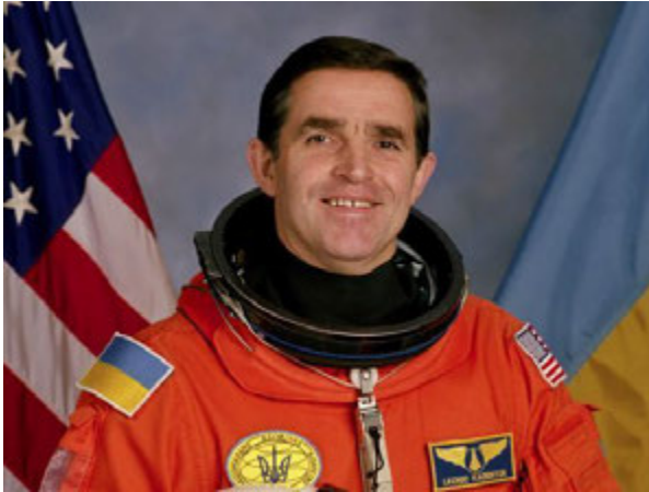
Фото 5. Леонід Каденюк. Перший космонавт незалежної України. У 1997 році здійснив політ у космос.