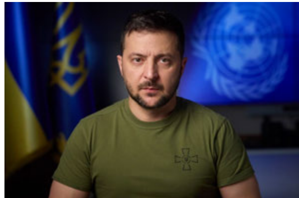
Фото 4. Президент України Володимир Зеленський виступає перед Генеральною асамблеєю ООН, 22 вересня 2022 р.