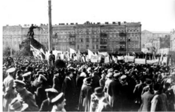
Фото 2. Велелюдна демонстрація у квітні 1917 року на Софійському майдані в Києві, яка стала частиною Української Революції.