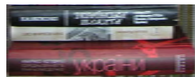
Обкладинка книжки Наталі Яковенко